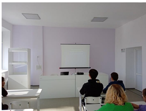
– Профилактический час – «Ответственность несовершеннолетних за употребление ПАВ» – 7-9 классы.