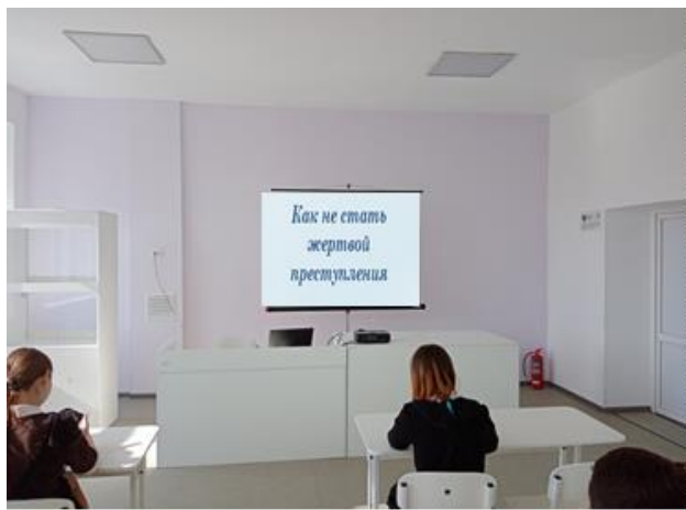
– Беседа – «Как не стать жертвой преступления» – 8-9 классы.