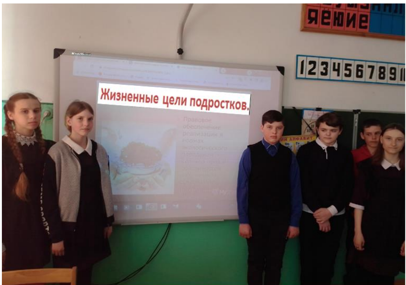
– «Жизненные цели подростков» – 8 класс.