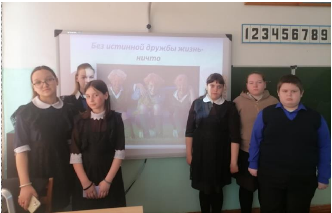
– «Роль друзей в становлении личности» – 6 класс.