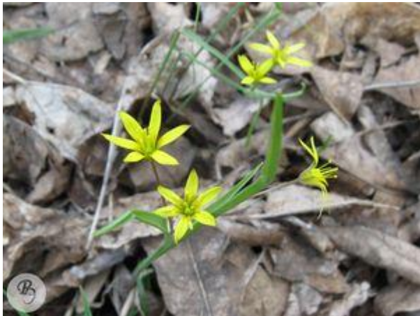
Гусиный лук краснеющий