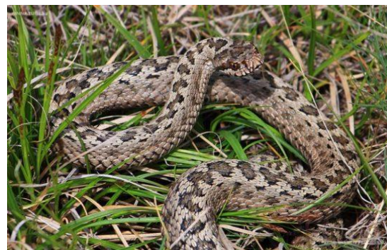
Восточная степная гадюка